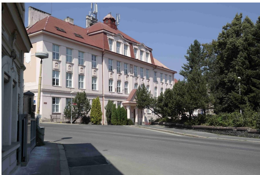
stejný pohled v roce 2013