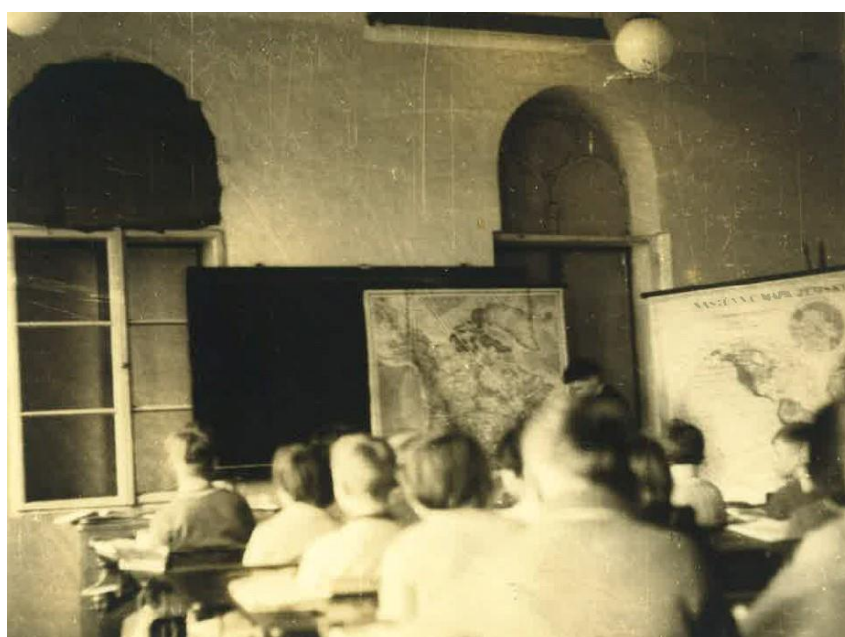
Učebna zeměpisu 60.léta