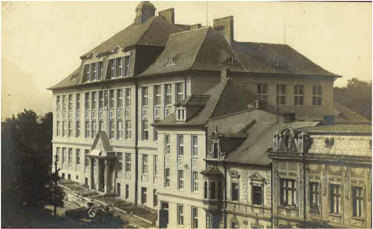
Škola v roce 1923