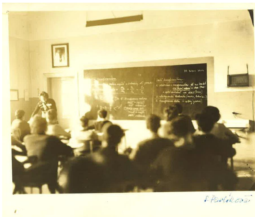
Učebna fyziky – 60.léta p.uč, Pavlíková