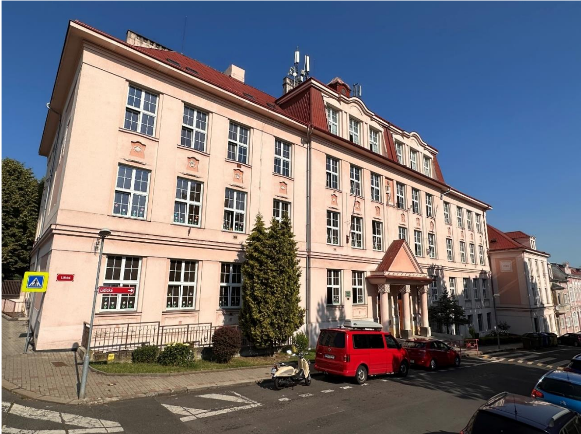
Škola rok 2023