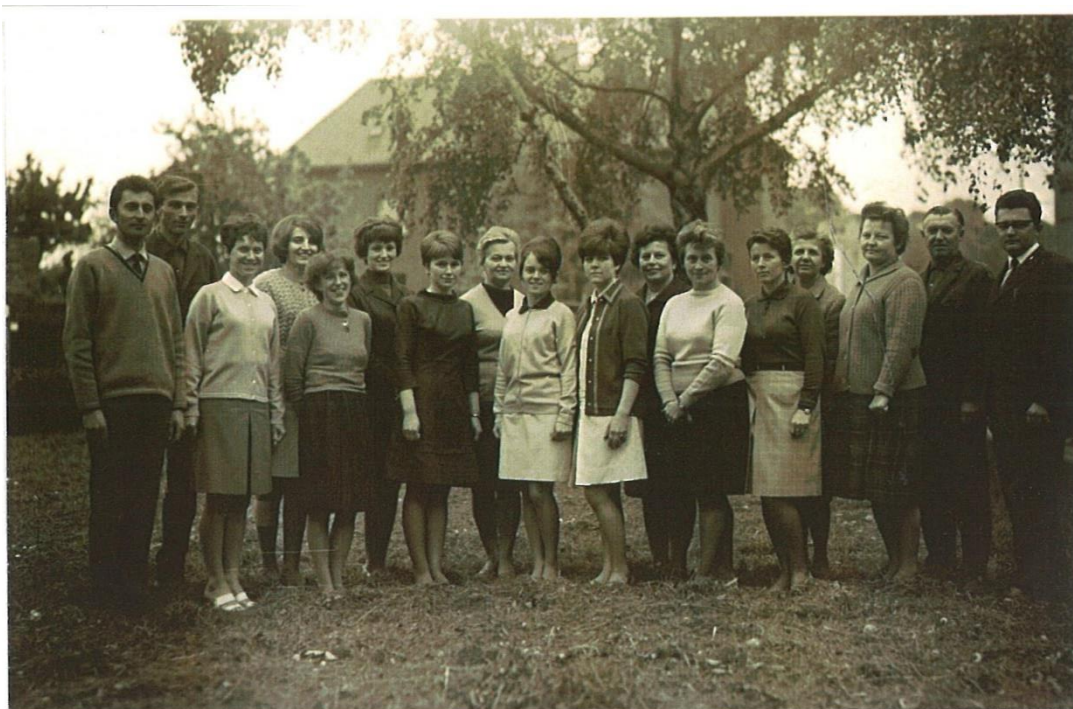
učitelský sbor ve školním roce 1967/68