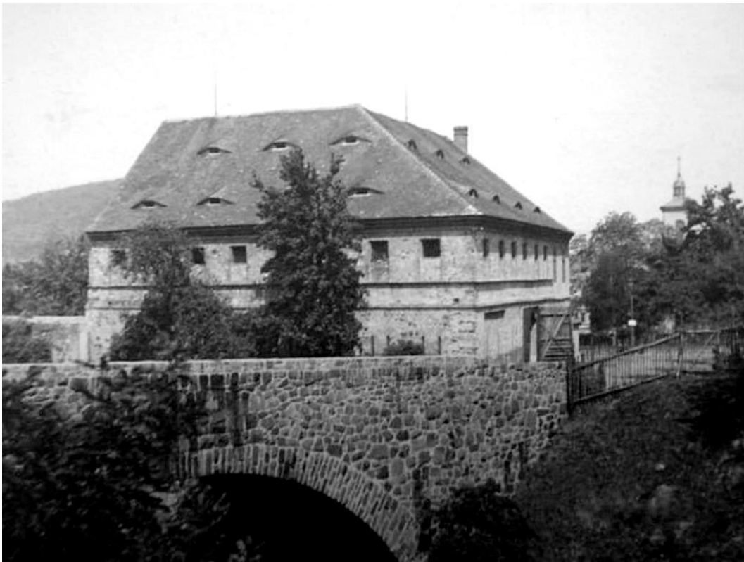
Stodola, v níž sídlila škola na počátku 20.století