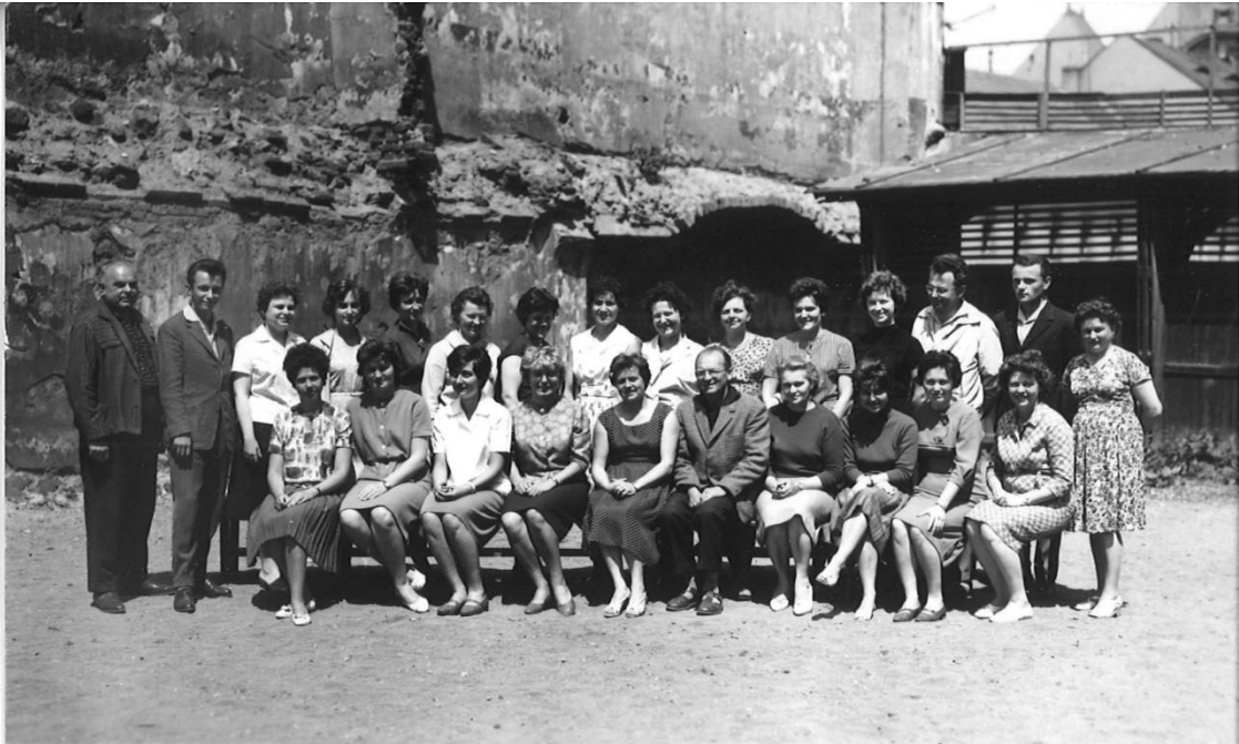
Učitel'ský sbor 1962-63