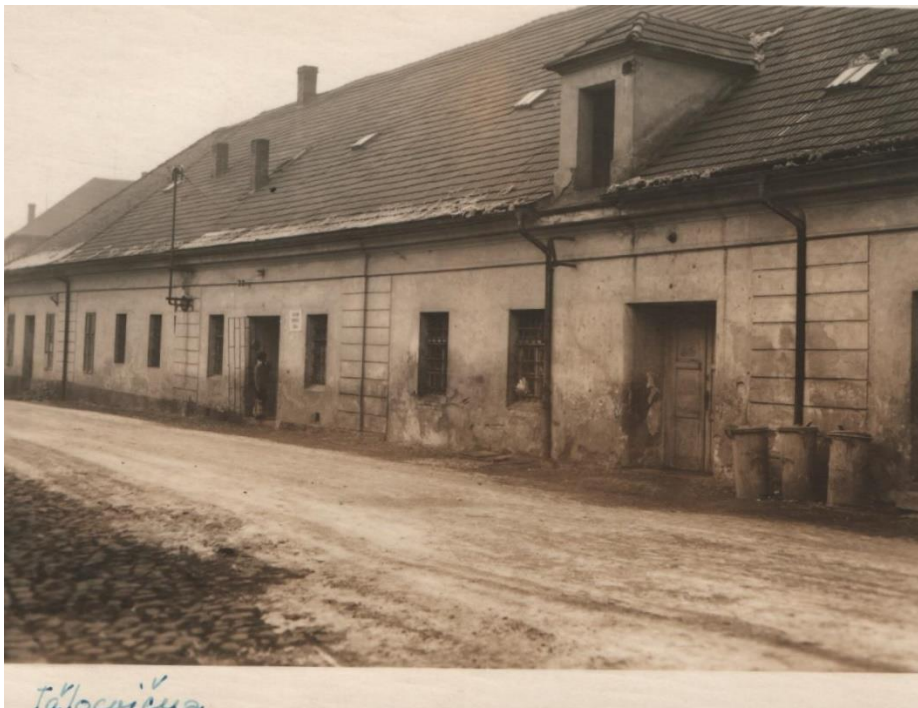
Škola Mírové náměstí zima 1964