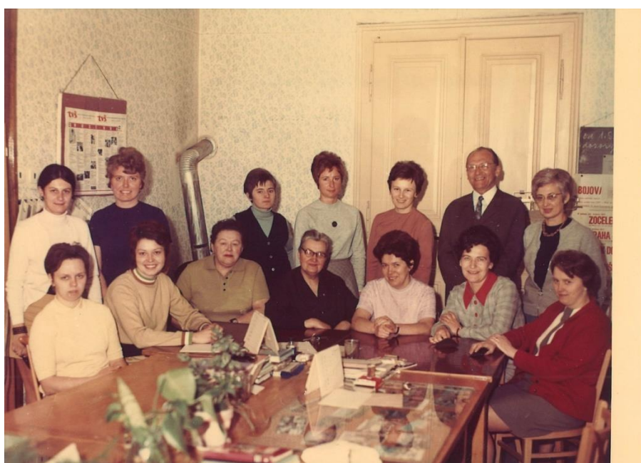
uč. sbor 1971