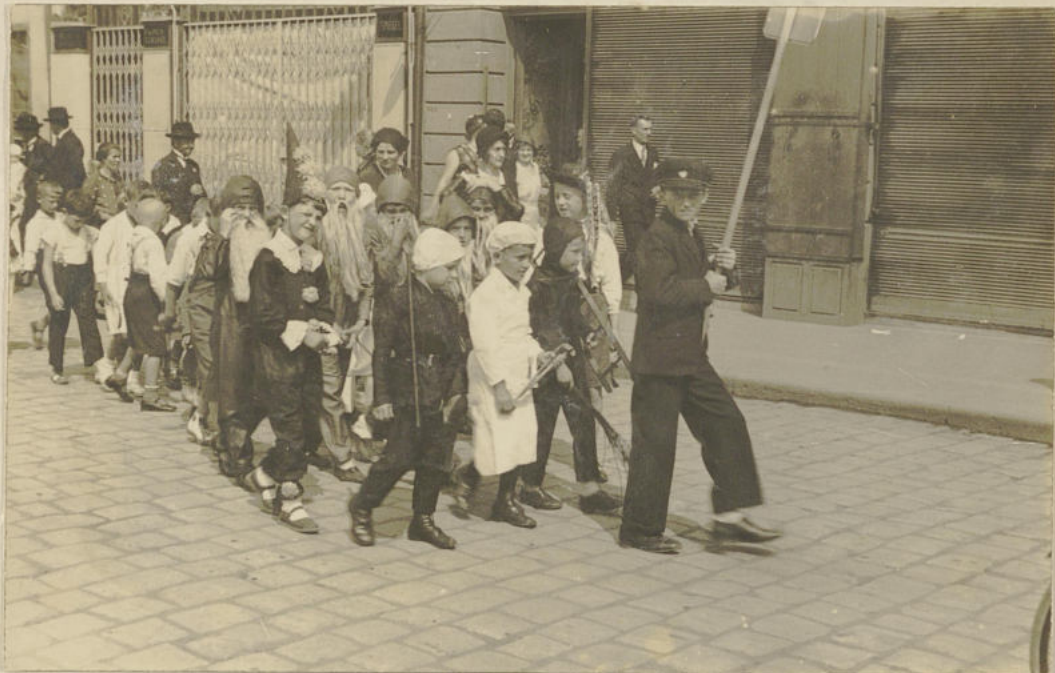
Privod žáků s dětským divi 12./6. 1932:-