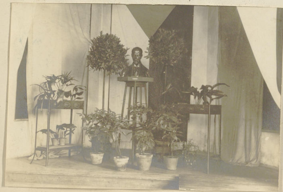
Oslava 82. narozenin francouzské republiky dne 7. března 1933 :