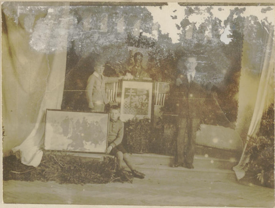
28. říjen v lelocvičské školní.