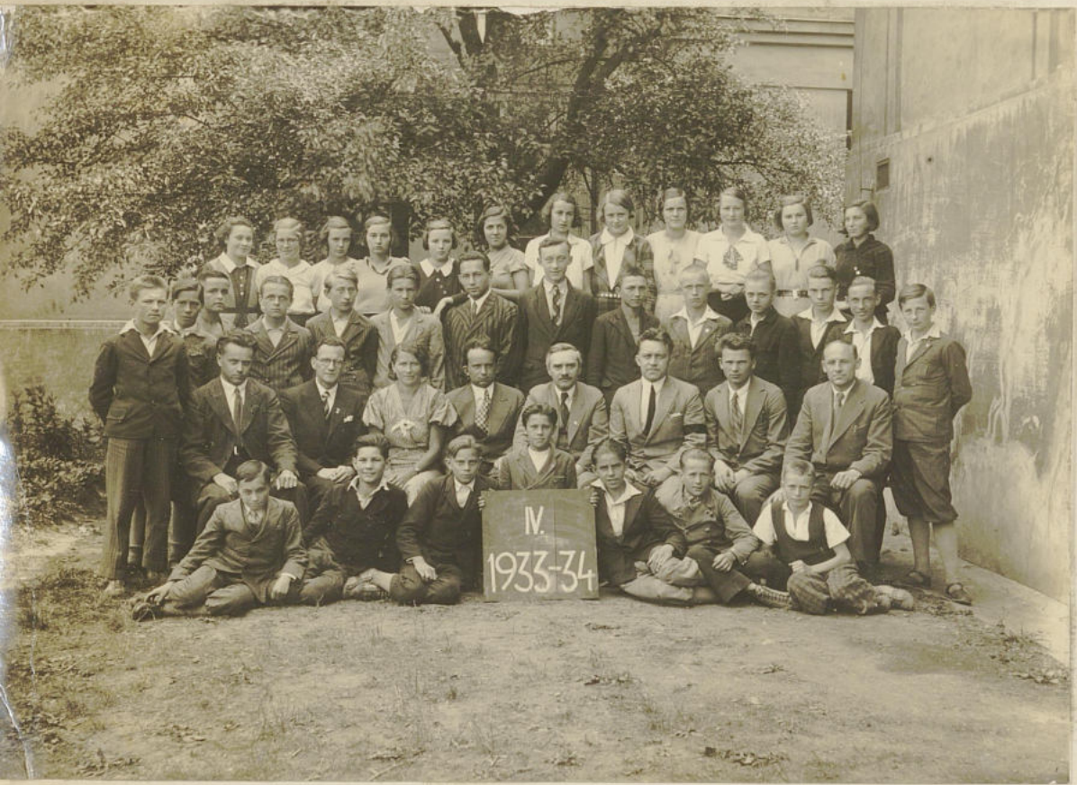
IV. ročník měš. školy a mělelský sbor měš. školy 1933-34.