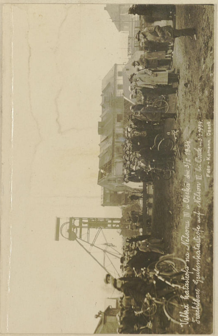
Velká katastrofa na Nelsonu III v Oseku dne 3/I 1934 Fuchsbau Gubenkatastrofe auf Nelson III bei Osek - 3. I. 1934.