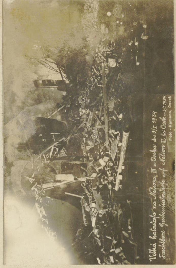
Velká katastrofa na Nelsonu III v Oseku dne 3/I 1934 Fuchsbau Gubenkatastrofe auf Nelson III bei Osek - 3. I. 1934.