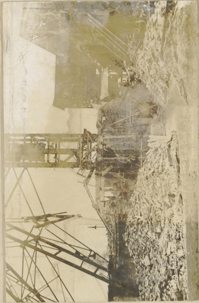
Velká katastrofa na Nelsonu III v Oseku dne 3/I 1934 Fuchsbau Gubenkatastrofe auf Nelson III bei Osek - 3. I. 1934.