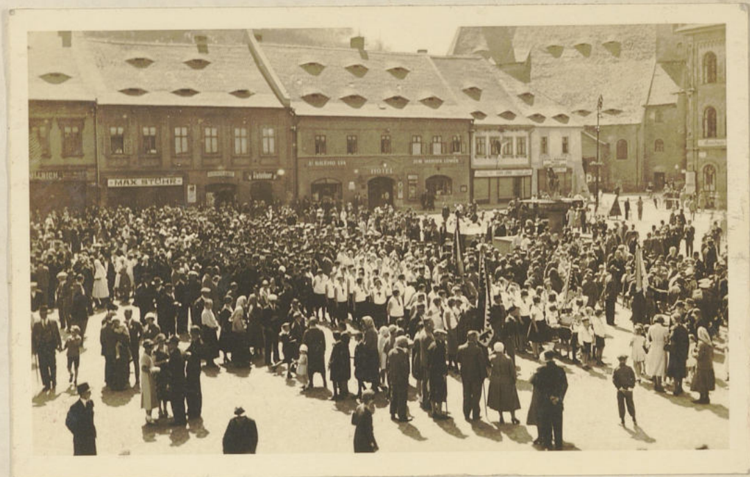
Pravnický den v Přílině 3.16.1933.